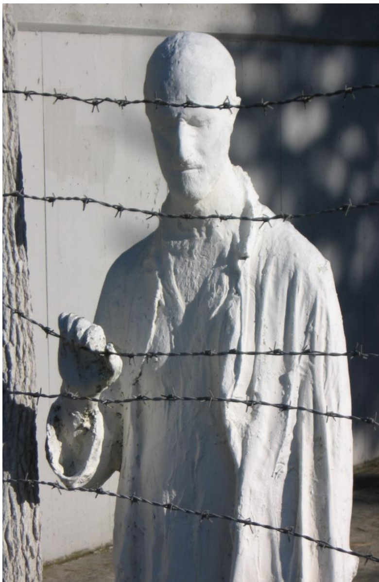
Holocaust Memorial (April 22, 2004) in front of Legion of Honor, San Francisco.